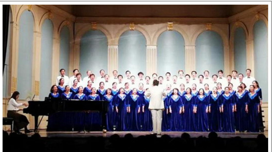
12月14日晚,校教工合唱团演唱《天路》,参演“新年欢歌”上海教工迎新合唱音乐会,展示了我校教工饱满的精神状态和良好的艺术素养。