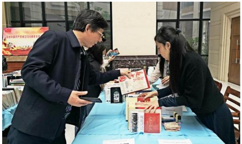
4月23日,图书馆特别推出“庆祝中国共产党成立100周年”主题书展活动。活动采用“你选书,我买单”方式开展,汇聚了数家国内重点大型出版社参展。图为观展师生进行现场选书荐书。(图书馆供稿)

际需要,引起现场观众浓厚兴趣。会展期间,“智能健康管理系统的产业化”“应用于5G显示-钙钛矿柔性量子点”“柔性LED灯丝灯”项目参与了由主办方举办的高校展区“创智汇”线上线下路演活动,并获得与会专家的认可。(科技研究院供稿)