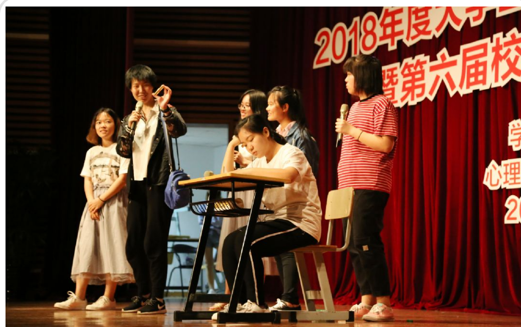
5月28日晚，2018年度大学生心理心理健康活动月闭幕式举行，同学们通过生动有趣的表演展现了大学生校园生活的种种心理问题，并给出了心理困境的应对方法。

座谈会上，校长与学生面对面，积极回应学生意见建议，为学生成长出谋划策。与会学生干部表示，此次座谈会是一堂精彩的人生成长课，将把学校的希望和要求、交流学习的内容带到同学中去，为学校建设具有国际影响力的高水平应用技术大学、同学们成长为具有创新精神和国际视野的高水平应用技术人才共同努力。（校团委 供稿）