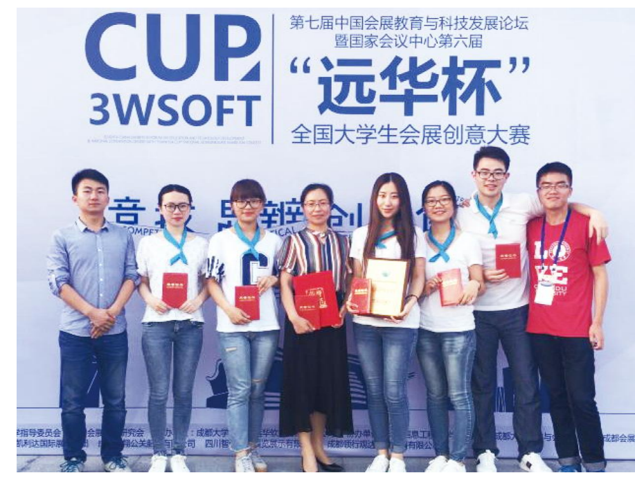
荣获一等奖(详见3版) 我校学生参加第六届“远华杯”全国大学生会展创意大赛

出席会议的民主党派和党外代表人士就师生普遍关心的问题及学校未来的发展提出了自己的意见和建议,对继续深入实施教师激励计划、推进科研团队和协同创新平台建设等形成广泛共识。