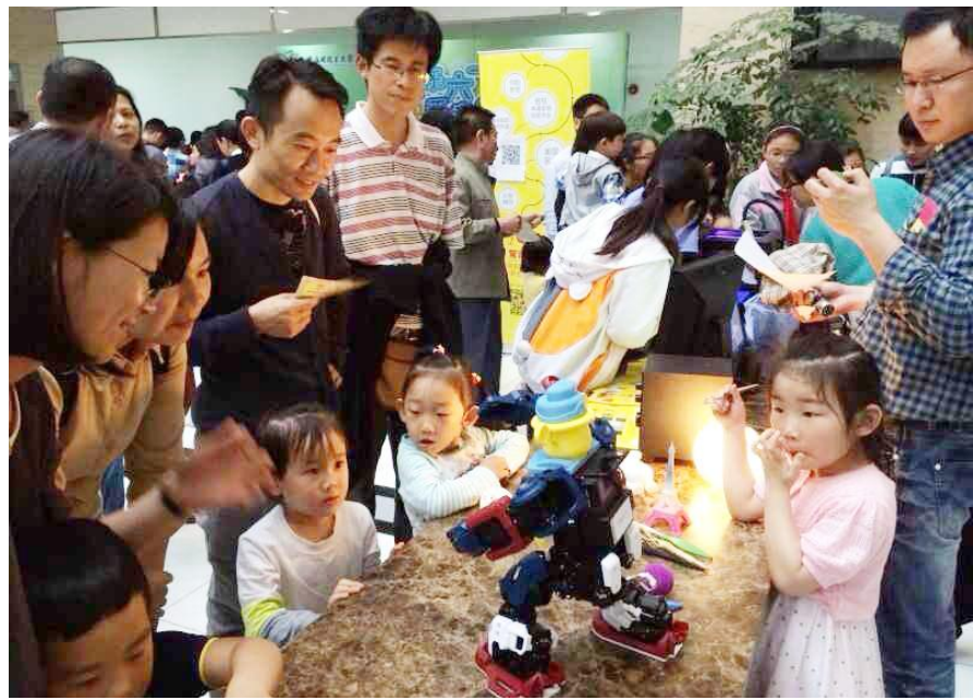
彩的亲子活动。图为小朋友聚精会神地观看机器人表演。六一儿童之际,学校为教职工及其子女举办了丰富多